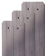
szürke-fehér antik karcolt FusionProtect